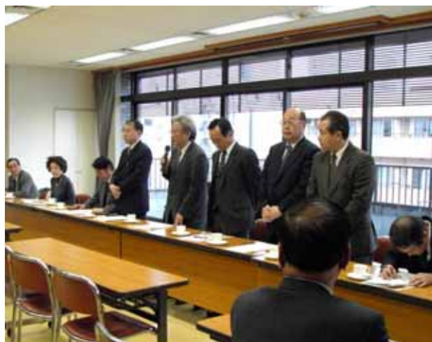
・ 新役員あいさつ