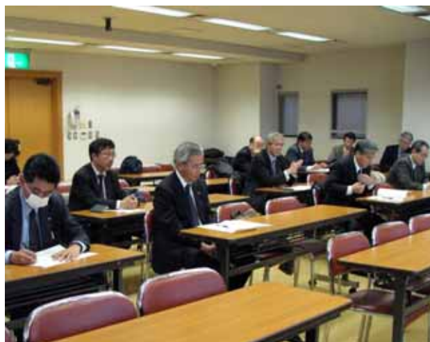
・ 総会風景 (於 : 測量地質健保会館 7 階大会議室)