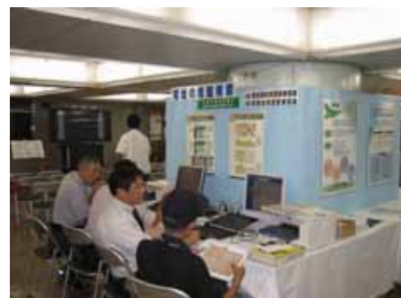
パソコンによる 地盤検索コーナー