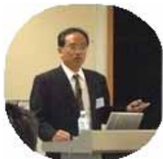
(独)建築研究所 上席研究員 田村昌仁氏

平成 19 年 11 月 2 日「北とぴあ」にて「東京都 2007 技術フォーラム」を開催した。