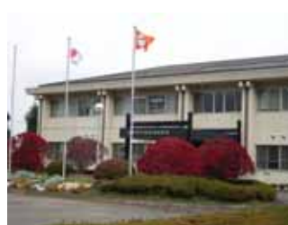
会場 (長野県中信農業試験場)

11月16日(金)に「平成19年度長野県環境測定分析協会技術研修会」が開催され、土壌・地下水汚染調査に関する講演と実演を行い、会員企業 25 社(会員企業 83%に相当)39 名の方の参加がありました。